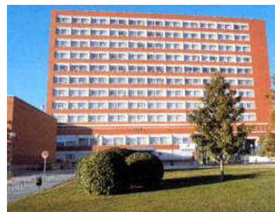
Facultad de Filosofía – Edificio B C/ Prof. Aranguren, s/n Ciudad Universitaria / 28040 - Madrid