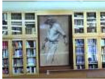
Biblioteca de Filosofía Sala de Lectura

Todo estudiante puede solicitar en la Biblioteca de Filosofía la adquisición del material bibliográfico que precise para sus estudios o investigación. Existe también un servicio de préstamo interbibliotecario.