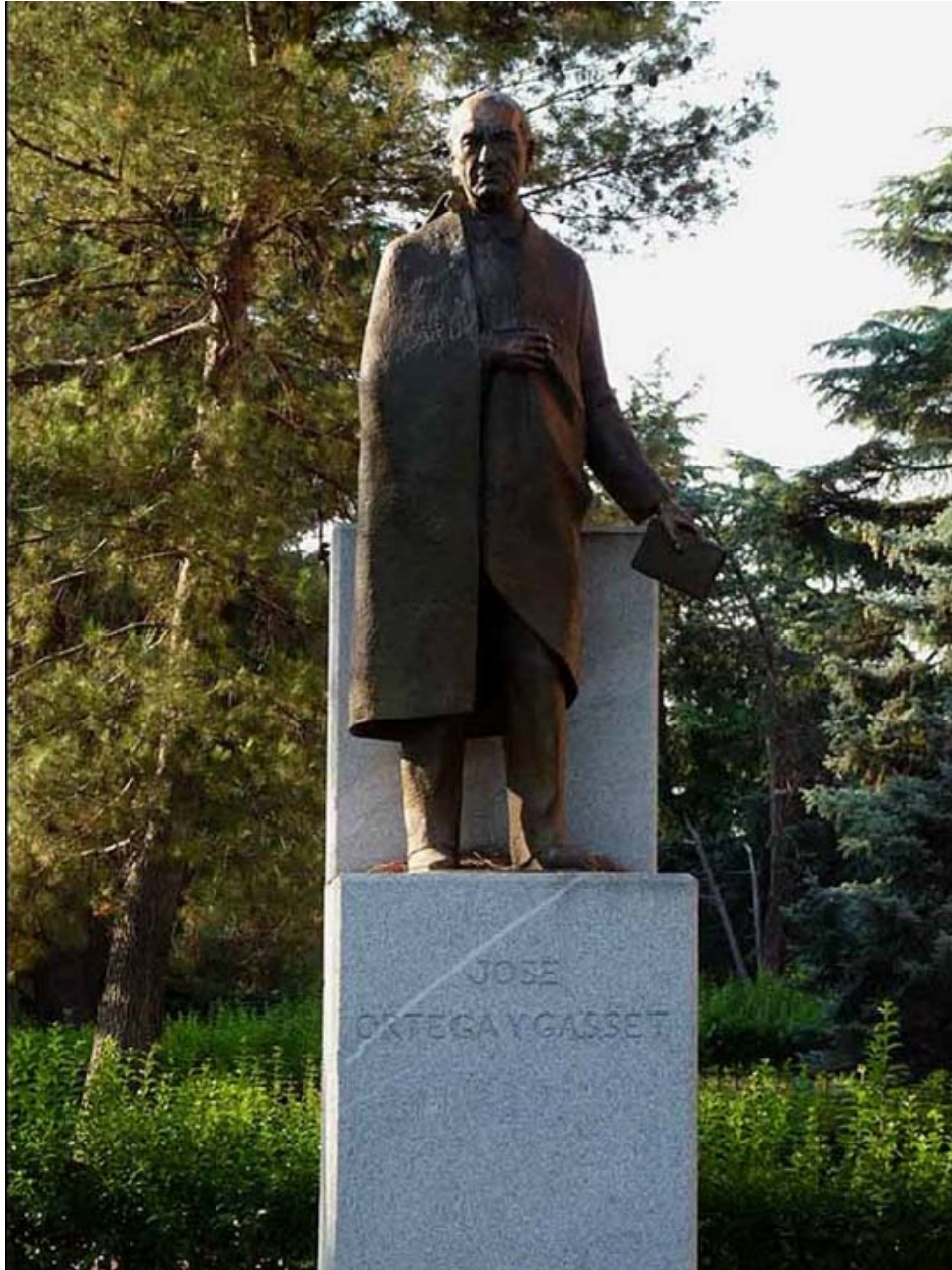
Escultura de José Ortega y Gasset en los jardines de la Facultad de Filosofía de la UCM