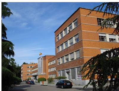
Facultad de Filosofía – Edificio A Pz. Menéndez Pelayo, s/n Ciudad Universitaria / 28040 - Madrid

La Facultad de Filosofía está situada en el CAMPUS DE MONCLOA, en la Ciudad Universitaria. Desarrolla sus actividades y servicios en dos edificios: el EDIFICIO A ("FILOSOFÍA A") compartido con la Facultad de Filología y el EDIFICIO B ("FILOSOFÍA B") compartido con la Facultad de Geografía e Historia.