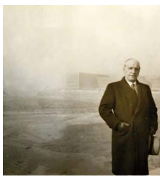
José Ortega y Gasset ante la Facultad de Filosofía y Letras (1934)